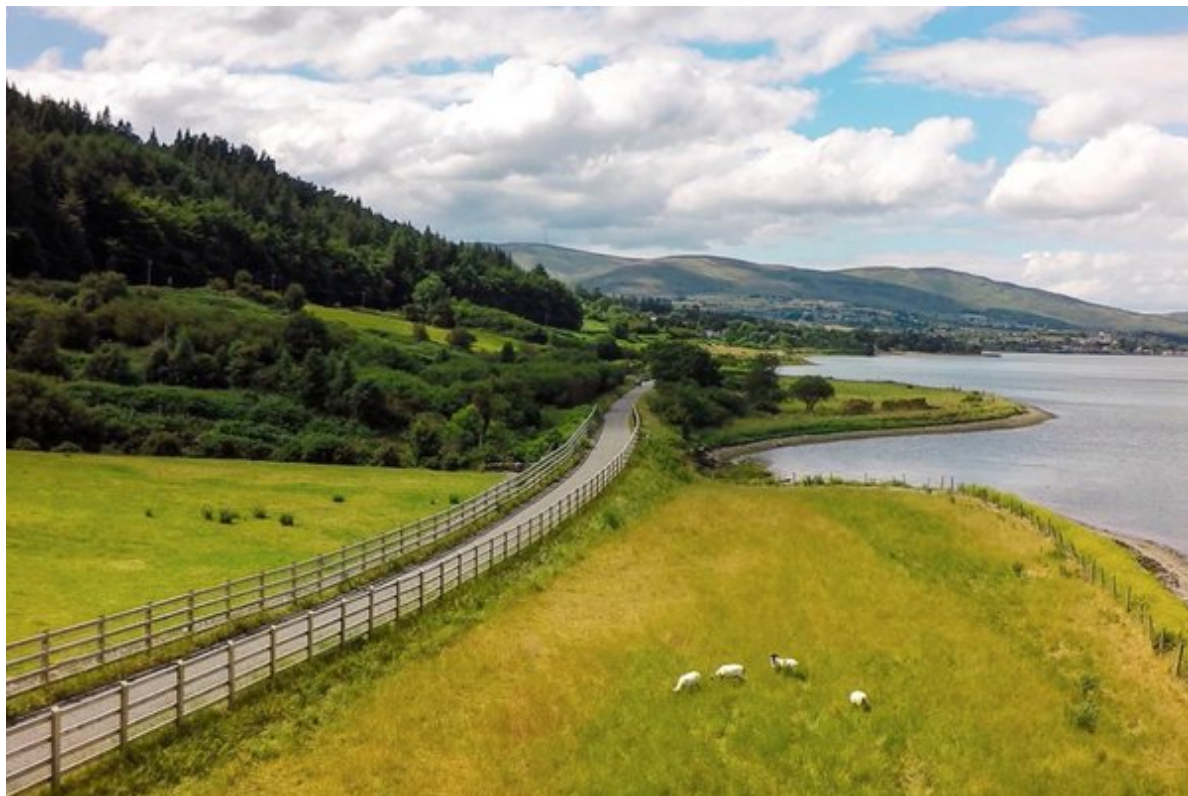
Glasbhealach Loch Chairlinn

Reáchtáladh cruinniú Iompair CATT in Ard Mhacha ar 12 Nollaig 2016. D'fhreastail Shane Ross TD, Aire Iompair, Turasóireachta agus Spóirt, Chris Hazzard CTR, Aire Bonneagair agus Alastair Ross CTR, Aire Sóisearach, ar an chruinniú.