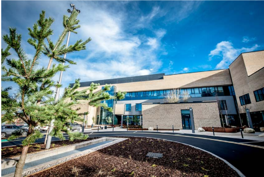
An tAonad Nua Radaiteiripe in Ospidéal Réigiúnach Allt Mhic Dhuibhleacháin