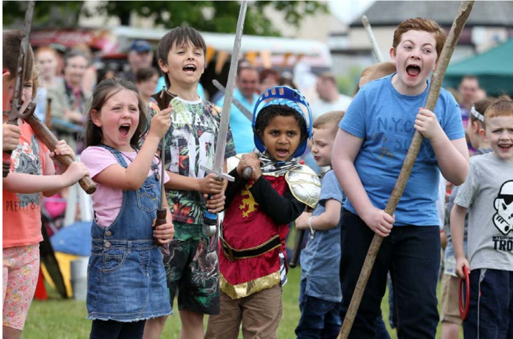
Saighdiúirí an Rí – Féile Mheánaoiseach Bhrús i mí an Mheithimh 2016