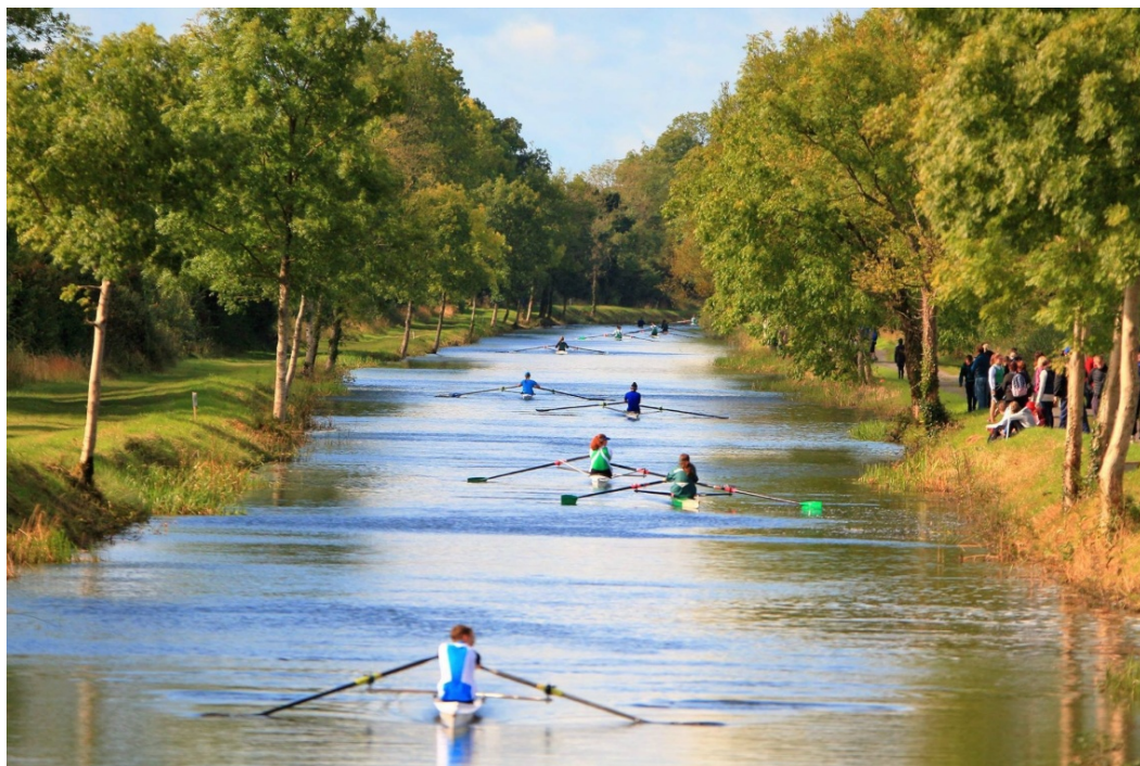
Triail Ama Thulach Mhór, An Chanáil Mhór, Deireadh Fómhair 2016

Reáchtáladh cruinniú Uiscebhealaí Intíre CATT ar 24 Meitheamh in Ard Mhacha. D'fhreastail Chris Hazzard CTR, Aire Bonneagair, Paul Givan, CTR, Aire Pobal agus Sean Kyne TD, Aire Stáit le freagracht as Gnóthaí Gaeltachta agus Acmhainní Nádúrtha, ar an chruinniú.