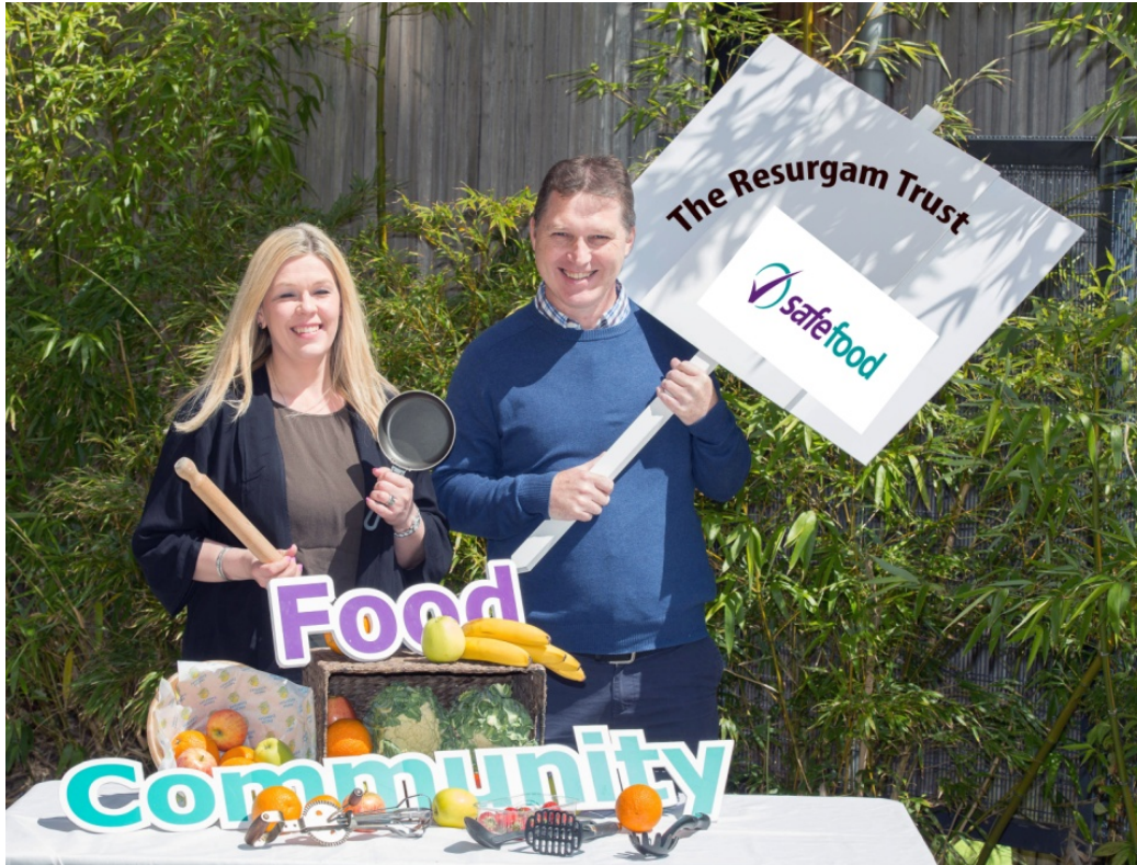
Tionscadal Iontaobhas Resurgam i Lios na gCearrbhach, ceann de na 13 thionscadal a fuair maoiniú ó Chlár na dTionscnamh Bia Pobail 2016-18.