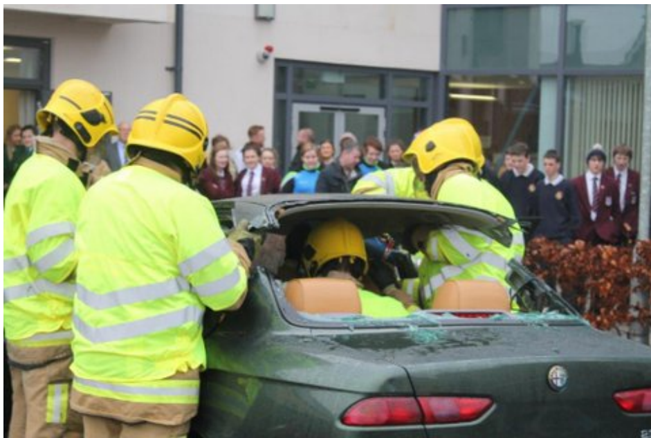
Pearsanra ó Sheirbhís Dóiteáin agus Tarrthála Thuaisceart Éireann ag ócáid for-rochtana CATT do mhic léinn i mí Eanáir 2016

I ndiaidh na gcur i láthair, bhí deis ag daltaí ó na scoileanna a ghlac páirt ann, ról na nAirí ón Fheidhmeannas agus ó Rialtas na hÉireann a imirt, agus ghlac siad páirt i mbréagchruinniú na Comhairle Aireachta Thuaidh Theas chun ceisteanna sábháilteachta a phlé, agus chun socrú ar bheartais amach anseo.