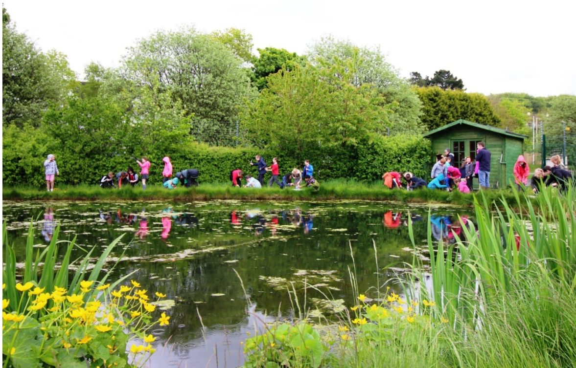
Daltaí bunscoile ag tumadh i linn ag Gníomhaireacht na Lochanna

Reáchtáladh cruinniú Dhobharshaothrú agus Chúrsaí Mara CATT ar 14 Meán Fómhair 2016 in Ard Mhacha. D'fhreastail Denis Naughten TD, Aire Cumarsáide, Gníomhaithe ar son na hAeráide agus Comhshaoil, Michelle McIlveen CTR, Aire Talmhaíochta, Comhshaoil agus Gnóthaí Tuaithe, Seán Kyne TD, Aire Stáit le freagracht as Gnóthaí Gaeltachta agus Acmhainní Nádúrtha, agus Chris Hazzard, CTR, Aire Bonneagair, ar an chruinniú.